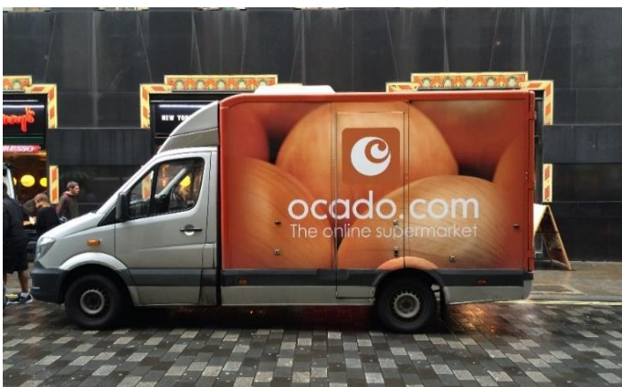
Ocado, die Nr. 1 der Pure Player in Großbritannien

Eine britische Erfolgsgeschichte schreibt dagegen Ocado. Ursprünglich im Jahre 2000 als Joint Venture mit Waitrose gegründet, hat sich der Anbieter zum größten britischen Pure-Online-Player im Lebensmitteleinzelhandel entwickelt. Ocado bietet seither auch Systemlösungen für Drittkunden an. Nach der Abtrennung des Systemhauses wurde 2019 die Partnerschaft mit Waitrose durch Marks & Spencer abgelöst.